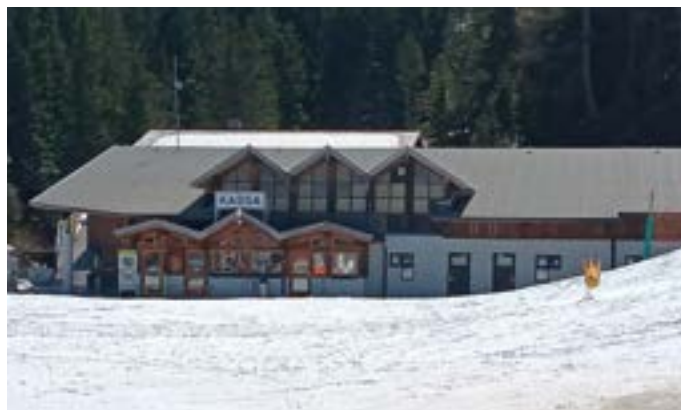
Die Tröglbahn wird nach fast 4 Jahrzehnten erneuert.

So fand Ende März die eisenbahnrechtliche Verhandlung über den Neubau der Tröglbahn statt. Die bisherige 4er-Sesselbahn wird nach ca. 40 Jahren durch eine moderne 6er-Sesselbahn ersetzt. Die umfangreichen Umbauarbeiten bedingen aber auch gewisse Bautätigkeiten der Stadtgemeinde bei den Wasserversorgungseinrichtungen. Gleichzeitig wird aber von den Bergbahnen Nassfeld Pramollo AG auch das Bürogebäude vom Nassfeld zur Talstation in Tröpolach verlegt. Zudem werden dort auch andere Betriebe investieren, sodass es über den Sommer zu erheblichen Bautätigkeiten in diesem Be-