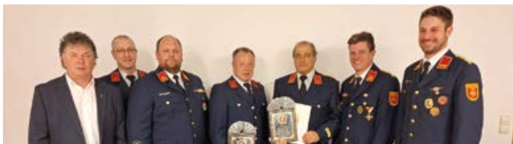
JHV der FF Mellweg im Gemeinschaftshaus.