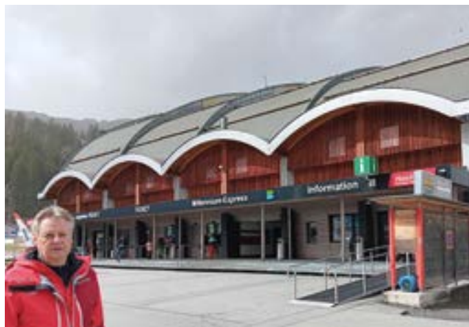
Umbaumaßnahmen sollen Attraktivität des Millenniums-Express steigern.

reich kommen wird. Aber nicht nur im Skigebiet, sondern auch am See sind Investitionen in diesem Jahr geplant. U.a. wird die Stadtgemeinde die Sanierung des Strandbades Pressegger See starten. Bis zum Sommer soll zumindest ein Teil des neuen