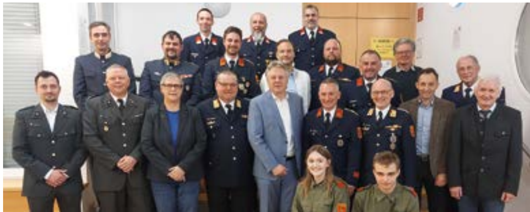
Jahreshauptversammlung der FF Hermagor.

Am 17. Februar 2024 fand im Gemeinschaftshaus in Mellweg die diesjährige Jahreshauptversammlung der FF Mellweg statt. Es wurden zwei neue Kameraden in die Feuerwehr aufgenommen, wobei aber auch drei Florianis in den Altkameradenstand getreten sind. Des Weiteren wurden drei Kameraden für 40 bzw. 50 Jahre in der Feuerwehr geehrt.