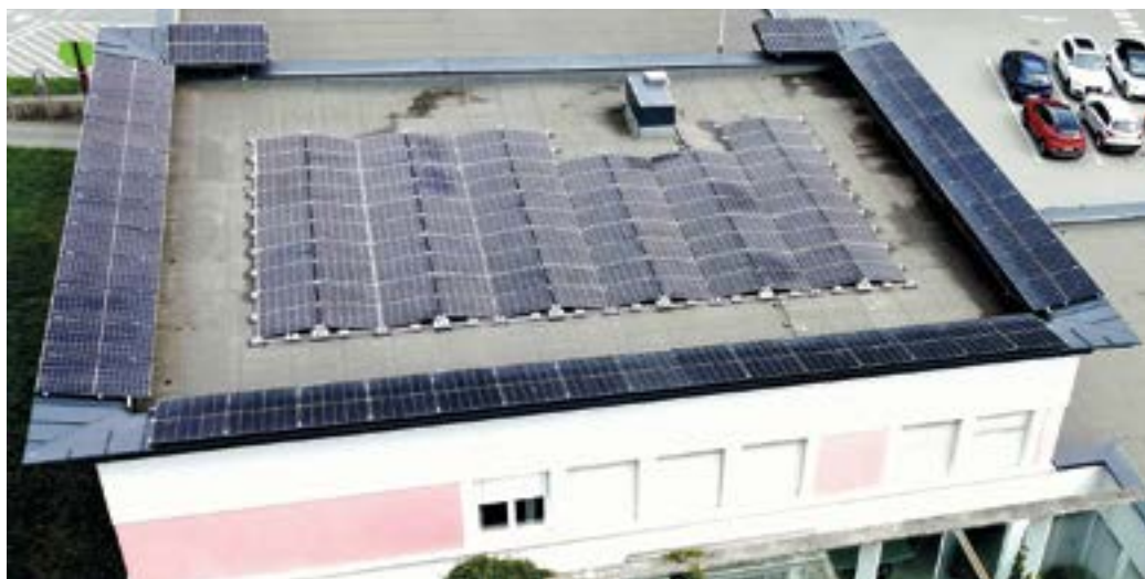
Neue PV-Anlage am Dach der Musikschule (42,57 kWp).

Das neue Kärntner Raumordnungsgesetz erfordert die Erstellung eines neuen Örtlichen Entwicklungskonzeptes. Nach einer Ausschreibung der