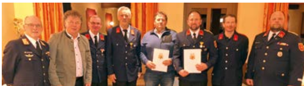
JHV der FF Radnig im GH Grollitsch.