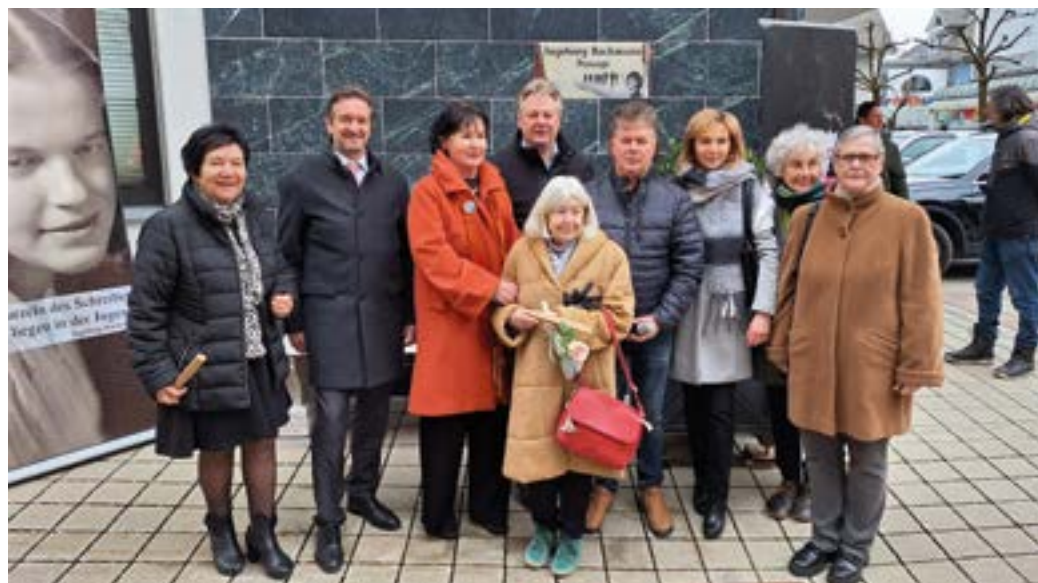
Eröffnung der Ingeborg Bachmann Passage.