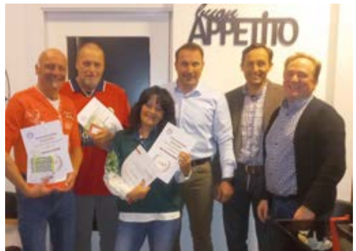
Geehrte Funktionäre des SC Vellach mit Präsidenten.