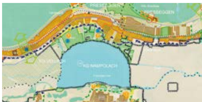
Ausschnitt aus dem alten ÖEK.

Daher werden alle Gemeindebürger zu einer Auftaktveranstaltung am Donnerstag, 23. Mai 2024 um 19 h in den Stadtsaal in Hermagor eingeladen. Näheres dazu finden Sie auf Seite 14 dieser Ausgabe.