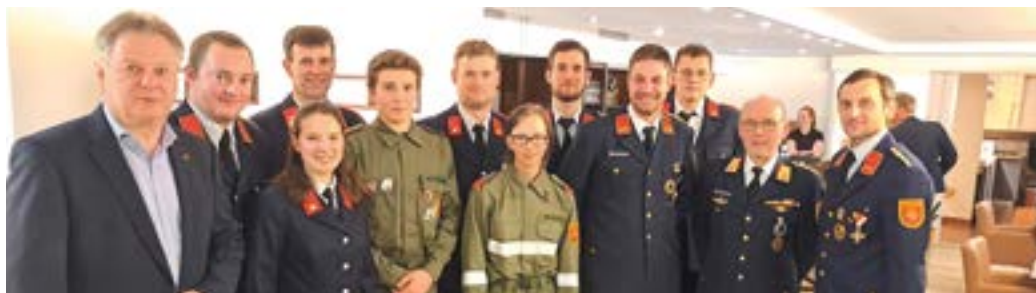
JHV der FF Watschig im Hubertushof.

Am 1. März 2024 fand die alljährliche Jahreshauptversammlung der FF Radnig im Gasthaus Grollitsch statt. Im Anschluss des ausführlichen Jahresberichtes des Kommandanten und der beauftragten Funktionäre folgten noch die Grußworte der Ehrengäste und es wurden auch noch einige Ehrungen und Beförderungen abgewickelt. Am 2. Februar 2024 hielt die