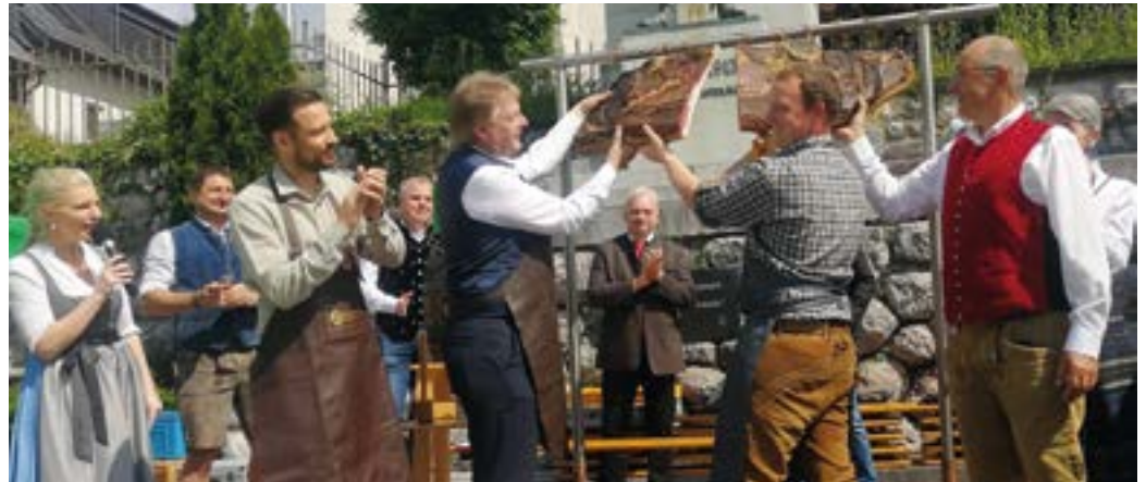
Speckanschnitt im letzten Jahr