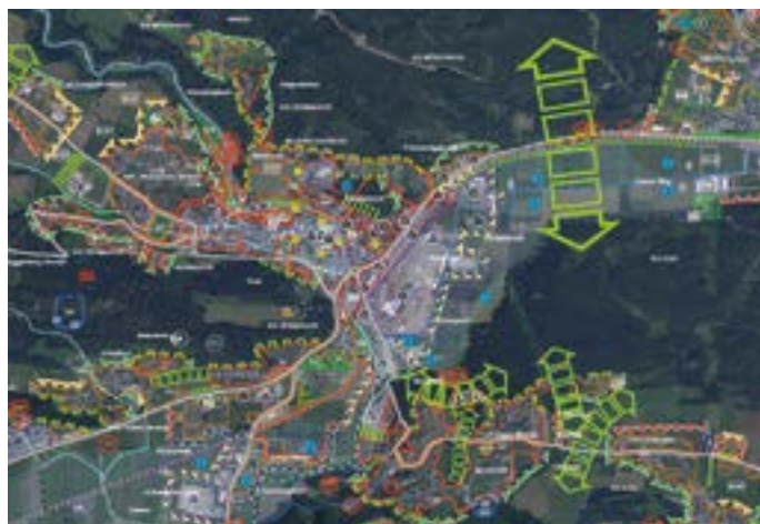
Auszug aus dem derzeit gültigen Örtlichen Entwicklungskonzept.

Die Erstellung des ÖEK sieht eine umfassende Form der Einbindung der Bürgerinnen und Bürger vor. Zu diesem Zweck wird die Bevölkerung der Stadtgemeinde Hermagor zu einer