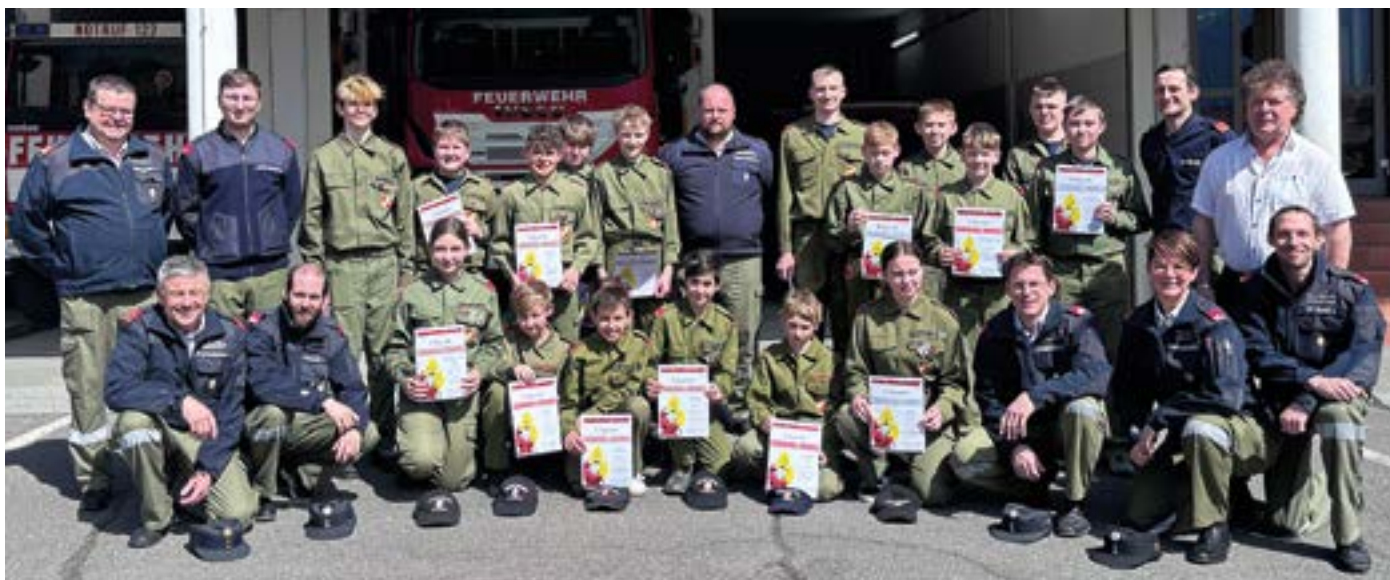
Herzliche Gratulation allen Jugendmitgliedern zu den hervorragenden Leistungen!