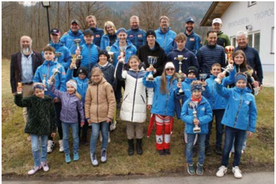
Endsiegerehrung SV Tröpolach.

Die Endsiegerehrung fand am 23. März 2024 am Sportgelände des SV Tröpolach statt. Der diesjährige Gesamtsieg in der Vereinswertung ging an den OSK Kötschach-Mauthen mit 5641 Punkten, gefolgt vom SV Tröpolach mit 5154 Punkten, dem SC Hermagor mit 4263 Punkten, DSG Lesachtal mit 2725 Punkten, dem SV Weißbriach mit 1712 und dem GSK Gundersheim mit 60 Punkten. Als Sportreferent möchte ich mich recht herzlich bei allen ehrenamtlichen Funktionären und Helfern sowie bei den Eltern und den jungen Sportlerinnen und Sportlern bedanken. Erst sie machen es möglich, dass Rennen veranstaltet werden können. Ebenso ergeht mein Dank an die Liftbetreiber,