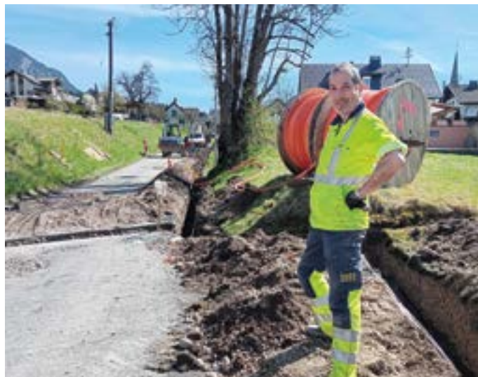
Glasfaserausbau in Förolach.