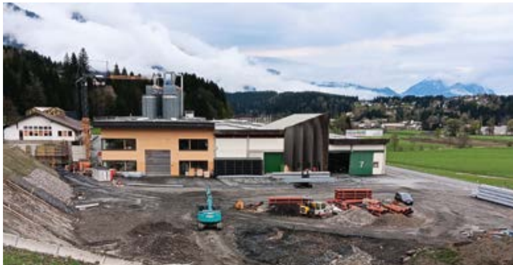
Die Fa. Hasslacher Norica Timber investiert derzeit große Summen am Standort in Kühweg.

Für das vorangegangene Jahr 2023 wurde vor kurzem der Rechnungsabschluss erstellt. Dieser weist zwar in der Ergebnisrechnung (inkl. AfA, Rückstellungen udgl.) ein leichtes Minus, aber in der Finanzierungsrechnung doch einen positiven Saldo auf. Gegenüber dem Budgetvoranschlag war dies eine sehr erfreuliche Entwicklung. Verantwortlich dafür sind vor allem Steigerungen bei den Einnahmen aus der Kommunalsteuer, welche auf eine gute wirtschaftliche Entwicklung unserer heimischen Klein- und Mittelbetriebe schließen lässt. Ein großes Danke daher allen Unternehmern und Arbeitnehmern! Ich hoffe, dass auch dieses Jahr die Auftragslage und damit die Beschäftigungszahlen wieder so gut sein werden. Etliche